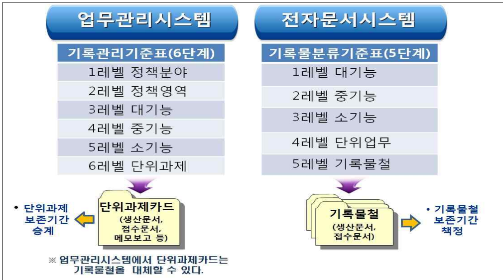
그림 1 - 기록생산시스템의 분류 및 편철

분류는 논리적으로 구조화된 방식과 규칙에 따라 업무 행위나 기록물을 조직화하여 체계적으로 관리·활용하기 위한 업무 절차이다. 공공기관은 업무 과정이 반영될 수 있도록 분류체계를 마련하고 기록물관리에 활용하여야 한다.